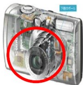
デジタルカメラ手振れ機構部