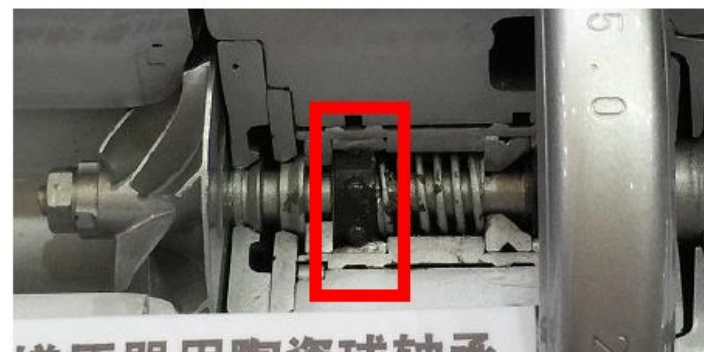
ターボチャージャー用セラミック軸受